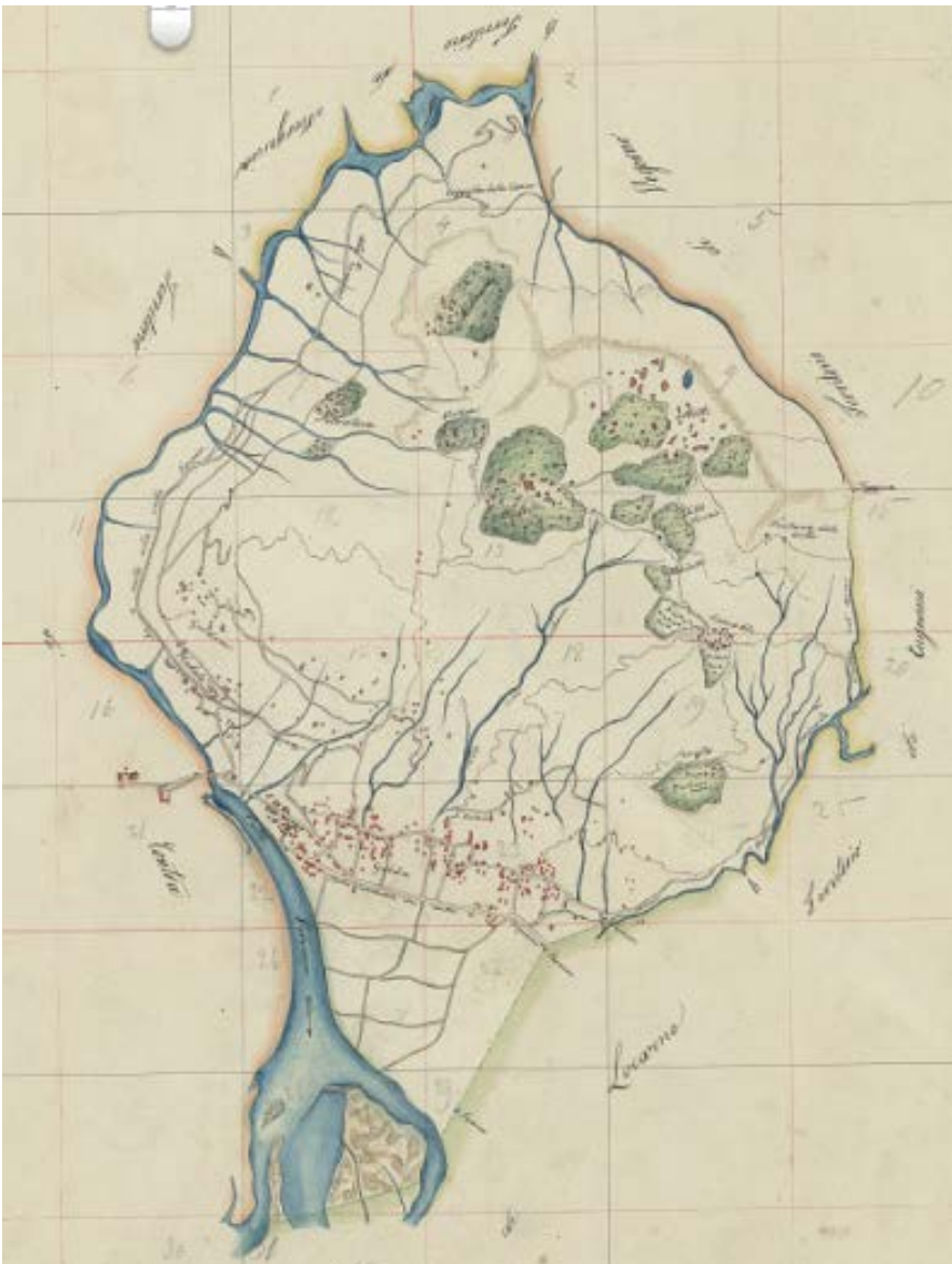
Mappa censuaria di Gordola rilevata nel 1850, ancora in vigore nella zona Monti.

I piani originali della mappa censuaria di Gordola sono depositati presso l'Archivio di Stato a Bellinzona mentre il Geometra revisore del Comune ha una copia su lucido della mappa e conserva i registri con i nominativi dei proprietari. Lo stesso è responsabile della stesura degli estratti censuari e della fornitura delle planimetrie.